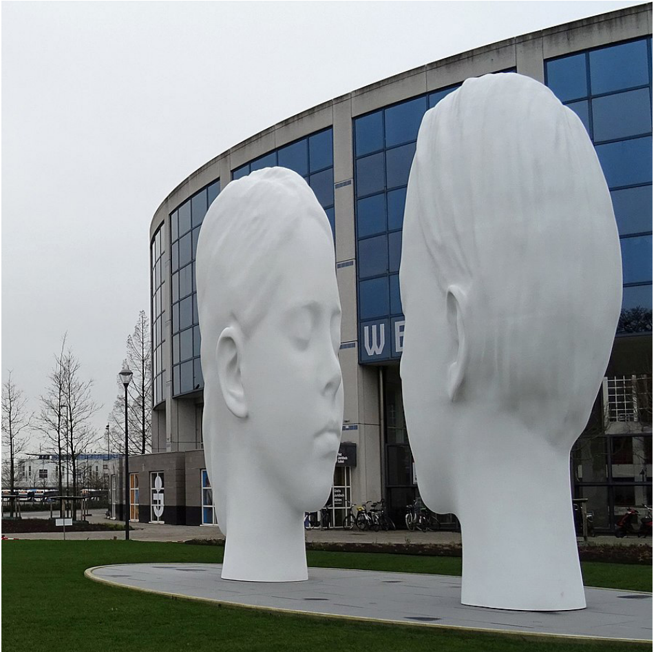
그림 3. 레이우아르던의 사랑 분수(Jaume Plensa), 2018, (© Sjaak Kempe)*

업들이 자사의 시제품을 축제에서 테스트하는 데 도움이 되었다. (...) 소통의 효과로 칭찬을 받고 있는 한 가지 뛰어난 사례로는 엘프베헨토흐트(Elfwegentocht)가 있는데, 이 행사가 진행되는 2주 동안 프리슬란트주 전체가 화석 연료 없이 운영되며, 전기차, 자동차, 보트 등 역대 최대 규모의 퍼레이드로 절정에 이른다.”